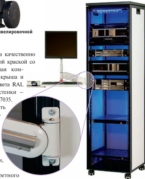
Рис. 9. Консольный пульт управления с креплением на струбцине

Автор – сотрудник фирмы ПРОСОФТ Телефон: (495) 234-0636 E-mail: info@prosoft.ru