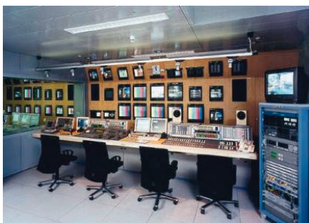
Рис. 6. Пример размещения шкафа в телевизионной студии