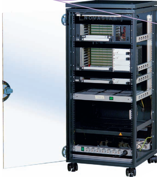
Рис. 7. Легкосъемные боковые стенки шкафа