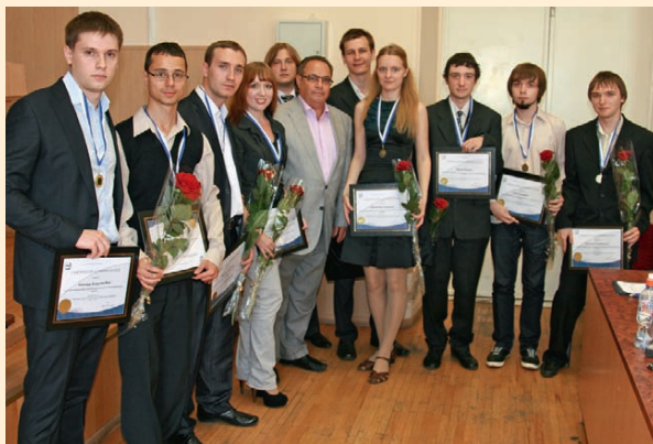
Награждение победителей ESPC-2011