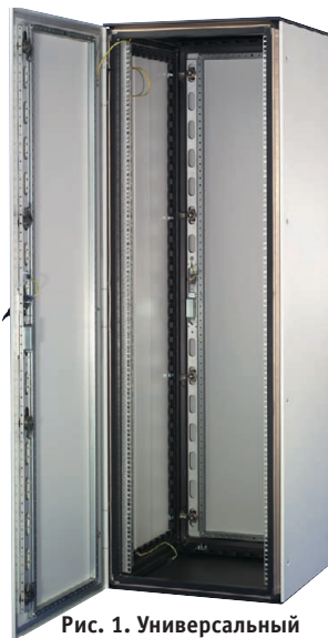
Рис. 1. Универсальный шкаф VARISTAR