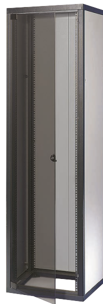
Рис. 2. Офисный шкаф Eurorack