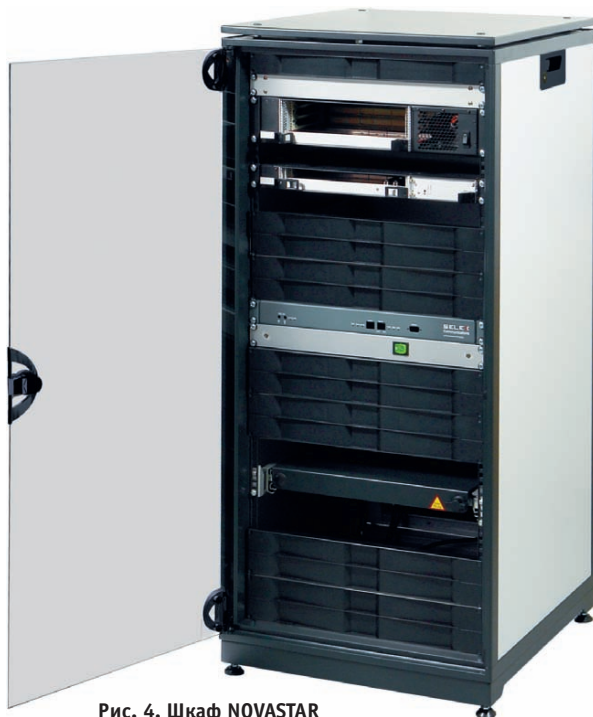
Рис. 4. Шкаф NOVASTAR