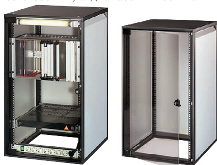
Рис. 3. Компактный шкаф Mini rack

Дополнительную прочность каркасу шкафа типа Heavy-Duty придаёт крепление профиля к панелям основания шкафа 2 болтами, а не одним, как было в шкафах прошлого поколения. Важной особенностью профиля каркаса