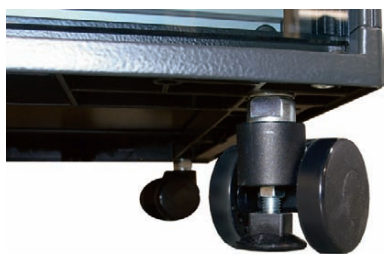
Рис. 8. Подвижная опора с нивелировочной ножкой

Все компоненты шкафа качественно окрашиваются порошковой краской со всех сторон. Стандартная комбинация цветов: каркас, крыша и цоколь – темно-серые, цвета RAL 7021, двери и боковые стенки – светло-серые, цвета RAL 7035.