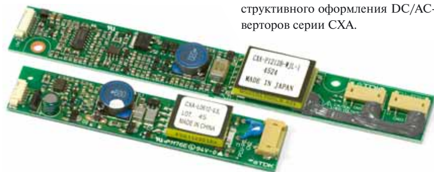
Рис. 3. Внешний вид конструкции DC/AC-инверторов, предназначенных для управления лампами задней подсветки ЖК-панелей

На рис. 3 приведены варианты конструктивного оформления DC/AC-инверторов серии CXA.