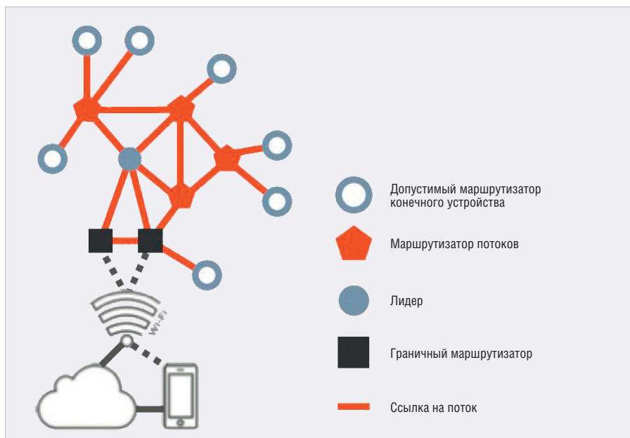
Рис. 11. Структура ячеистой сети Thread [66]

эти пакеты могут быть либо изохронными данными, либо широковещательной управляющей информацией.