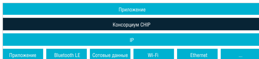
Рис. 8. Проект CHIP объединит конкурирующие технологии [45]

Основные стандарты совместимы «сверху вниз». Например, 802.11ax имеет обратную совместимость с ранее выпущенными стандартами Wi-Fi - 802.11a/g/n/ac, поскольку точка доступа Wi-Fi 6 использует специальный формат PDU для взаимодействия с клиентами каждого из перечисленных стандартов [51].