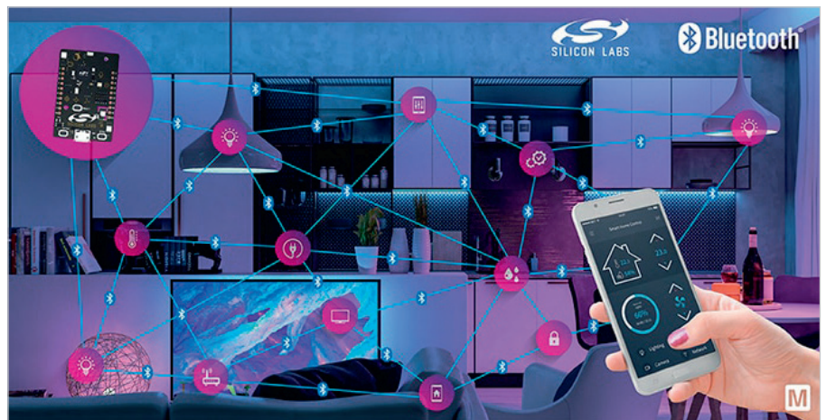
Рис. 10. Стандарт Bluetooth LE Mesh идеально подходит для многих решений «Умного дома» [61]

Существует два подхода передачи сообщений по сети. В одном случае используется классическая маршрутизация меш-сетей. В другом варианте по