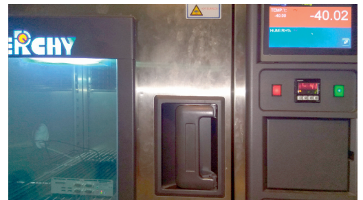
Рис. 4. Испытания при пониженных температурах (в климатической камере -40°C)

наружным осмотром и общей проверкой работоспособности. Сама технология испытаний повторяет уже описанную.