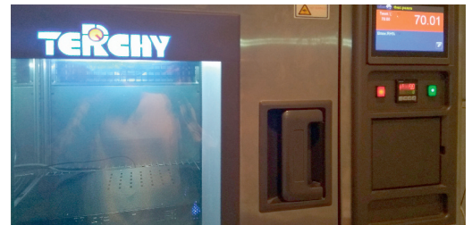
Рис. 3. Испытания при повышенных температурах (в климатической камере +70°C)