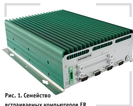
Рис. 1. Семейство встраиваемых компьютеров ER

О производителе промышленных ЭВМ — компании «Адвантикс» мы писали неоднократно. Эта компания уже более десятилетия специализируется на проектировании и изготовлении промышленных компьютеров. На счету её инженеров множество удачных разработок и технических решений. Сегодня мы