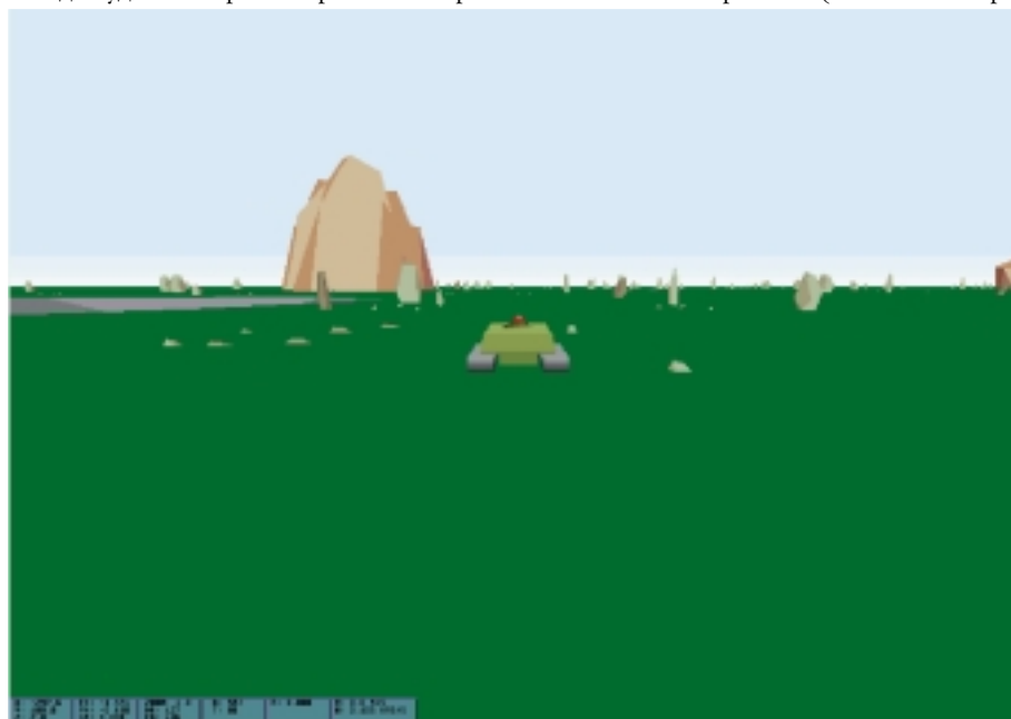
Рис. 2. Типичная тестовая ситуация, отображаемая на экране дисплея

В результате многолетних теоретических и практических исследований был разработан и создан целый ряд образцов многопроцессорных распределенных систем управления ИМР различного назначения. Данные разработки, в частности, проводились совместно с такими организациями, как ВНИИ транспортного машиностроения (г. Санкт-Петер-