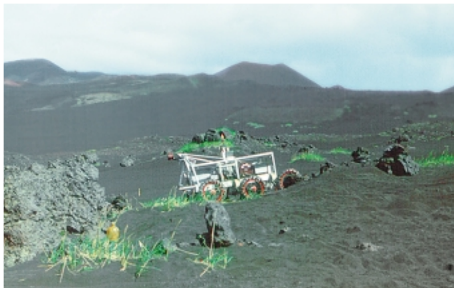
Рис. 4. Процесс испытаний прототипа интеллектуального мобильного робота-планетохода на Камчатке

В результате проведенных исследований разработаны алгоритмическое обеспечение, теоретические и практические основы построения многопроцессорных систем управления интеллектуальными мобильными роботами, которые могут быть использованы при