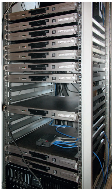
Рис. 1. Стойка серверов Advantix в едином диспетчерском центре города

или в режиме реального времени. Все объекты были разделены на несколько типовых групп. Внутри групп однотипные объекты можно легко сравнивать, выявлять факты неэкономного расходования ресурсов, фиксировать аварийные ситуации и наблюдать за их развитием или устранением. Умелое использование системы позволило руководителям некоторых объектов коммерческой недвижимости экономить сотни тысяч рублей ежемесячно. И это при том, что удельная стоимость внедрения составила менее 500 тыс. рублей на объект. На рис. 1 показана серверная стойка единого диспетчерского центра города.