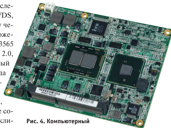
Рис. 4. Компьютерный модуль в форм-факторе COM Express

Рассматривая аппаратную часть, следует сказать, что модуль SOM-5788 оснащён ОЗУ DDR3 1066 МГц объёмом 8 Гбайт, а также поддерживает следующие интерфейсы: VGA, LVDS, HDMI и аудиовыход высокого разрешения. Архитектура процессора Intel® Core™ i7