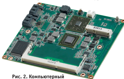
Рис. 2. Компьютерный модуль в форм-факторе ETX