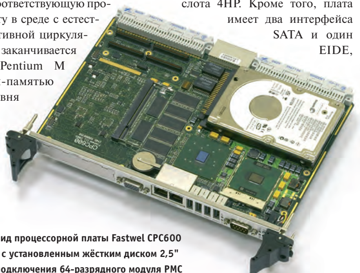
Рис. 2. Внешний вид процессорной платы Fastwel CPC600 модификации -02 с установленным жёстким диском 2,5" и возможностью подключения 64-разрядного модуля PMC

Fastwel CPC600 имеет уникальную архитектуру построения подсистемы хранения данных и программных компонентов. Помимо стандартных средств — интерфейса CompactFlash и napаянного на плате твердотельного диска ёмкостью 32 Мбайт — пользователи могут установить на плату два жёстких диска 2,5" и 1,8" с интерфейсами IDE либо одновременно, либо по выбору без выхода за габариты одного слота 4HP. Кроме того, плата имеет два интерфейса SATA и один EIDE,