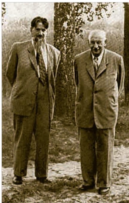
А. Ф. Иоффе и И. В. Курчатов (1955 год)