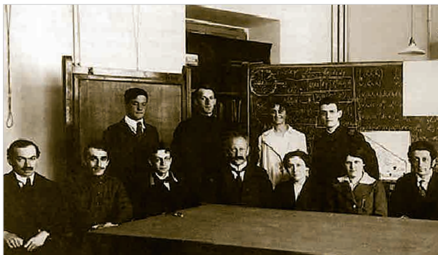
А. Ф. Иоффе и участники семинара в Политехническом институте (1915 год)