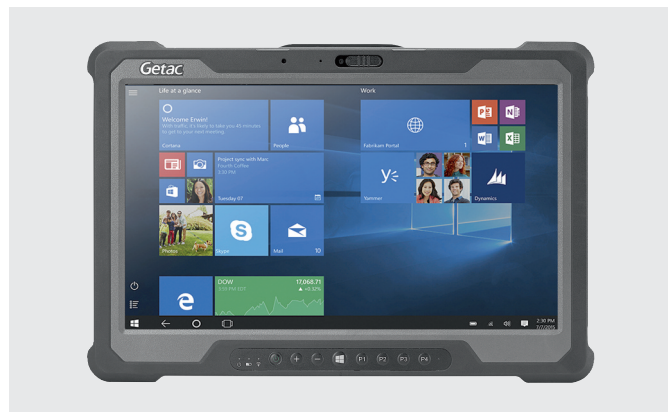
Рис. 3. Защищённый мобильный планшет

встраиваемые промышленные компьютеры, которые устанавливаются в труднодоступном месте для обслуживания локальных устройств. Их главные преимущества – безвентиляторный дизайн и широкий диапазон рабочих температур (рис. 2). Также на предприятиях используются переносные промышленные компьютеры (защищённые ноутбуки и планшеты). Как правило, их применяют операторы системы для быстрого локального сбора и анализа информации (рис. 3). И отдельно стоит отметить моноблочное исполнение промышленных или панельных компьютеров, о которых пойдёт речь в статье.