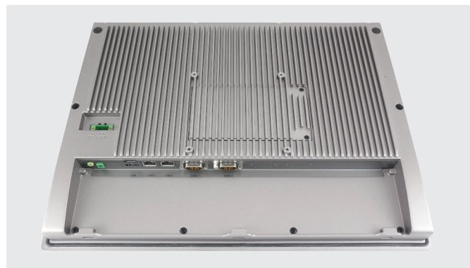
Рис. 5. Порты расширения панельных компьютеров AdvantiX

ще всего рассчитанный на номинал входного напряжения 12, 24 или 12...24 В. Достаточно распространены модели с расширенным диапазоном питающих напряжений 9...36 В для стабильной работы с автономными системами электропитания.