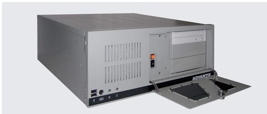
Рис. 1. Промышленный компьютер для установки в 19" стойку

В зависимости от сферы применения промышленные компьютеры имеют различные форм-факторы. Значительная часть корпусов предназначена для размещения в стандартной 19-дюймовой стойке (рис. 1). Такие компьютеры максимально часто используются предприятиями как вычислители, обслуживающие те или иные участки производства. Их основные функции — собрать данные с периферийных вычислителей, проанализировать полученную информацию и по результатам выдать команду, а также визуализировать технологические процессы. В качестве периферийных устройств часто выступают