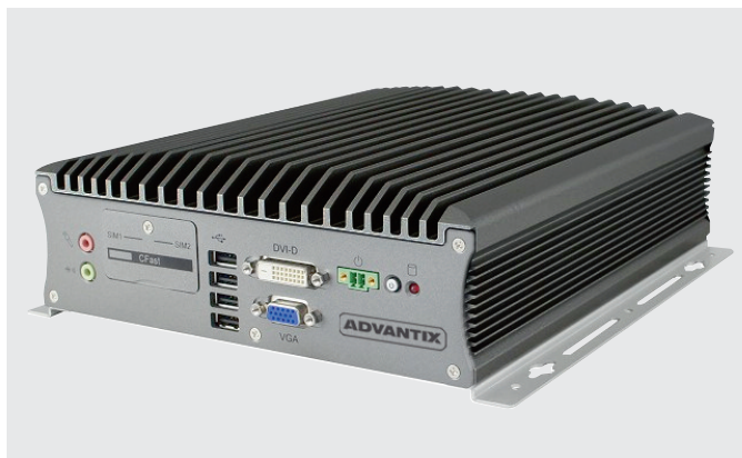
Рис. 2. Встраиваемый безвентиляторный компьютер