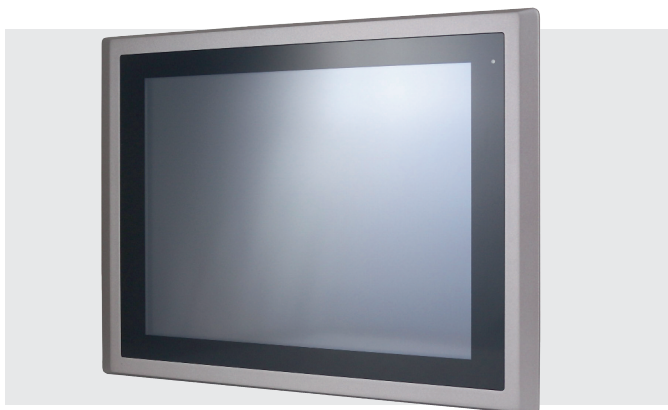
Рис. 4. Промышленный панельный компьютер AdvantiX серии PPC