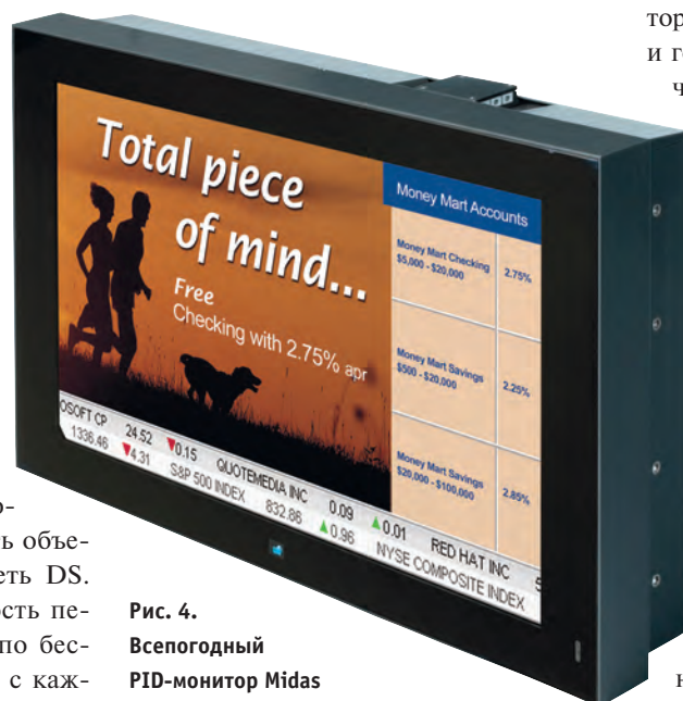
Рис. 4. Всепогодный PID-монитор Midas

Суровый российский климат заставляет системных интеграторов и операторов сетей DS в основном использовать Indoor-решения для построения систем отображения информации. А как обстоят дела с Outdoor-решениями? К сожалению, на сегодняшний день предложений, которые удовлетворяли бы требованиям по температурному режиму, немного. Разумеется, мы не будем рассматривать светодиодные уличные панно; они, как правило, не отвечают требуемому качеству отображения видеосигнала и предназначены для отображения текстовой информации. С учётом этого наиболее заметными предложениями для Outdoor DS на российском рынке яв-