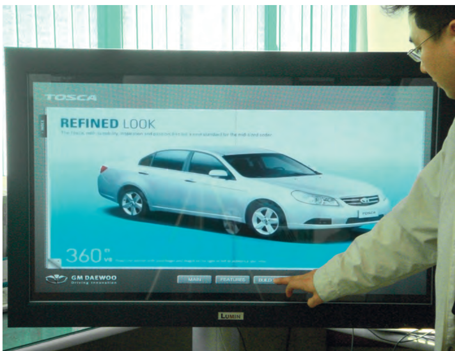
Рис. 3. Интерактивный цифровой монитор компании Lumin Vision

Одними из наиболее интересных интерактивных решений являются LCD- и PDP-мониторы производства южнокорейской компании Lumin Vision. Интерактивные цифровые информационные мониторы Lumin Vision оснащены встроенным ПК и интегрированной интерактивной оптической насадкой, за счёт которых и осуществляется обратная связь, то есть обеспечивается интерактивность. Одной из отличительных особенностей данных мониторов является большой ряд типоразмеров от 32 до 82 дюймов. Мониторы доступны в горизонтальном и вертикальном исполнениях, каждый вид исполнения предполагает наличие встроенного