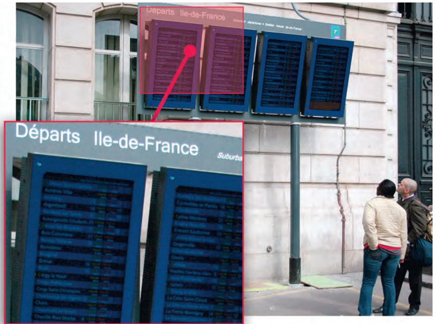
Рис. 5. Информационные дисплеи Midas, установленные на вокзале (Франция)

Уже упоминавшаяся встроенная система самодиагностики и управле-