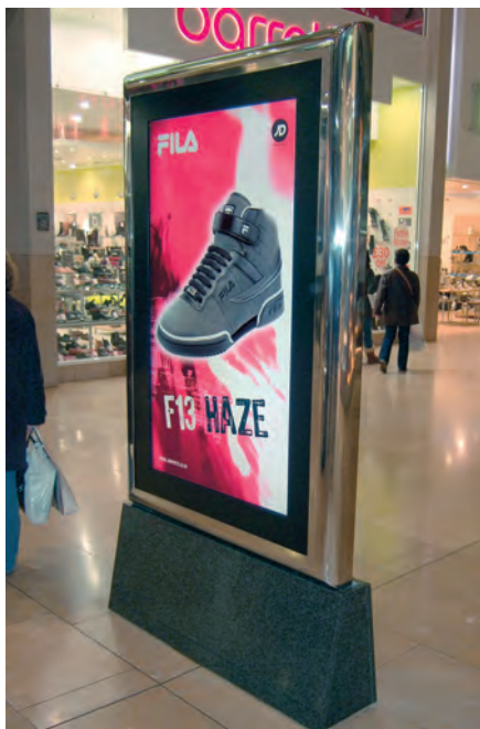
Рис. 2. Информационный дисплей D6

зорами для бытового применения велики. Мониторы для коммерческого использования предназначены для работы в режиме «24 часа 7 дней в неделю» на протяжении длительного срока; у них отсутствует множество неустойчивых в условиях специализированного применения функций и интерфейсов, что приводит к снижению стоимости; они могут поставляться в горизонтальном или вертикальном исполнении, часто имеют антивандальную защиту, встроенный ПК или медиаплеер, а иногда могут оснащаться интерактивным экраном. Телевизоры для домашнего применения такими особенностями не обладают.