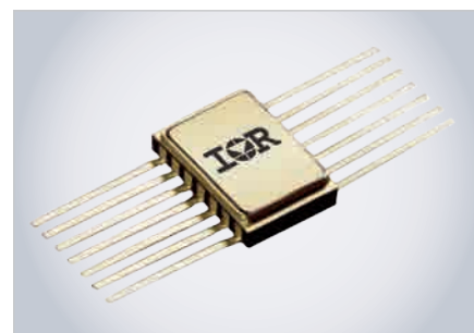
Рис. 2. Внешний вид микросхемы драйвера RIC7113A4

Радиационно-устойчивые – изделия с повышенным уровнем радиационной стойкости, разработанные для космических программ, со сроком активного существования до 3–4 лет, которые предполагают относительно низкое значение поглощённой дозы – в диапазоне от 5 до 25 крад. Одиночные эффекты также характеризуются низкими пороговыми значениями линейных потерь энергии (ЛПЭ) – в диапазоне от 37 до 40 МэВ•см 2 /мг. В конструкциях этих модулей могут применяться как компоненты со специфицированными показателями радиационной стойкости, так и обычные компоненты. Такие модули можно применять в аппаратуре низкоорбитальных КА, космических зондов для исследований дальнего космоса, в научных экспериментах и других подобных областях. Для применений с более длительными сроками активного существования (до 18 лет) на геосинхронных орбитах наиболее подходящими устройствами являются радиационно-стойкие изделия с предельным уровнем радиационной стой-