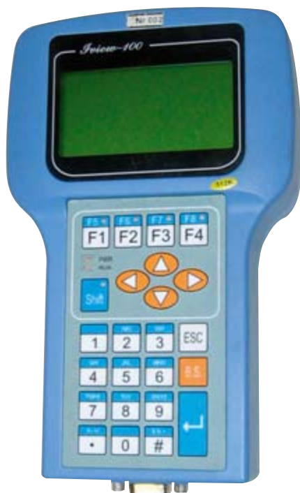
Рис. 4. Портативный контроллер, используемый в качестве программатора

Программатор предназначен для внесения параметров в контроллер садка, изменения текущих данных и отображения телеметрических параметров (напряжения батареи, температуры во-