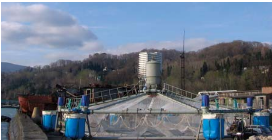
Рис. 1. ПАРС-2500 готов к спуску на воду

В подводном положении ПАРС выдерживает шторм со скоростью течения до 2 м/с. В надводном положении садок обслуживается при волнении моря до 3 баллов. При глубине акватории до 50 м ПАРС удерживают на грунте три гравитационных якоря, которые расположены в вершинах равностороннего треугольника со стороной около 100 м. Бункер, вмещающий 2 тонны гранулированного корма, обеспечивает автономность садка до 25 суток, в зависимости от веса рыб.