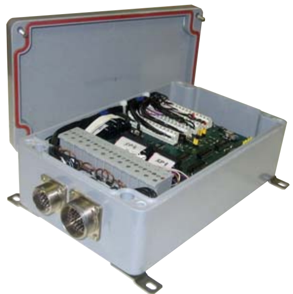
Рис. 3. Программируемый контроллер в водонепроницаемом корпусе

Для облегчения проведения работ по ремонту системы управления в открытом море контроллер выполнен в лёгком и компактном пластиковом водонепроницаемом корпусе фирмы Vorla с герметичными разъёмами, что максимально упрощает его транспортировку и монтаж, а также предохраняет от случайного попадания морской воды на электронные платы. Доступ к контроллеру осуществляется через ремонтный люк в центральном корпусе, когда последний находится в надводном положении. Если ремонт заключается в замене выходных транзисторов в цепях управления пневмоклапанами, можно, не извлекая контроллер, снять его крышку и заменить модуль с неисправным транзистором. Для этого управляющие транзисторы встроены в съёмные модульные корпуса фирмы WAGO.