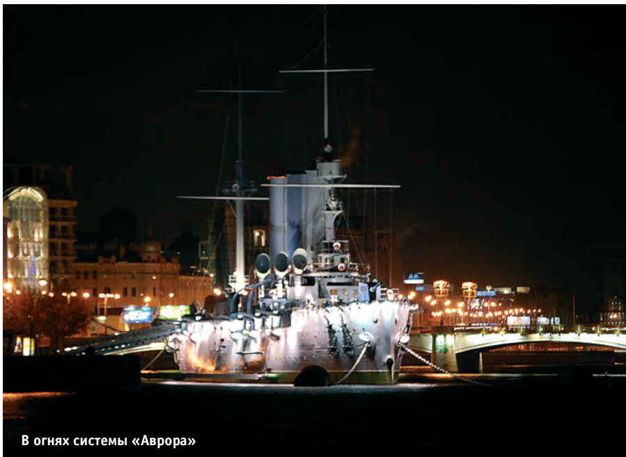
В огня системы «Аврора»

Наличие различных подходов к проектированию АСУНО, отсутствие в настоящее время стандартизации в этой области делают актуальной задачу формирования комплекса предъявляемых к АСУНО требований по составу функций. Остановимся на ряде основополагающих аспектов работы современных АСУНО и вытекающих из них конкретных требований к функциям оборудования, используя при этом, в том числе, и опыт ОАО «НИИ точной механики» (Санкт-Петербург) по разработке и внедрению таких систем в городах Ижевске, Калининграде, Москве, Санкт-Пе-