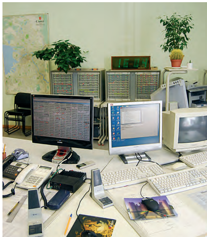
Рис. 2. Центральный диспетчерский пункт ГУП «Ленсвет», с которого управляются более 1000 ПВ

Различие в способах решения этих задач у отдельных фирм говорит не только об имеющихся технических возможностях, но свидетельствует также о недостаточном взаимодействии разработчиков и заказчиков при формулировании требований к АСУНО. Эта «недостаточность», особенно на начальном этапе