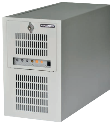
Рис. 6. Высокопроизводительная станция оператора FASTWEL AdvantiX IPC-ATX-7220 на базе процессора Intel Pentium Dual Core

щищённые компьютеры – это, как правило, либо магистрально-модульная, либо стековая система объединения модулей. Для построения магистрально-модульной системы применяются слотовые одноплатные компьютеры, которые устанавливаются в шасси с пассивной объединительной платой (кросс-платой). Примерами таких систем могут служить наиболее распространённые системы форматов CompactPCI, VME, AdvancedTCA, MicroPC. Защищённое исполнение в таких системах достигается путём применения защищённых шас-