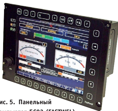
Рис. 5. Панельный компьютер БСОЗ (FASTWEL), построенный на базе COM-модуля CPB904 (FASTWEL) и предназначенный для применения на железнодорожном транспорте в кабине машиниста электровоза/тепловоза

Защищённые компьютеры, в отличие от панельных, которые также могут иметь защищённое исполнение, не располагают встроенными в шасси или корпус средствами организации HMI – попросту говоря, у них отсутствуют встроенный дисплей и клавиатура. За-