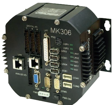
Рис. 8. Защищённый компьютер MK306 компании FASTWEL