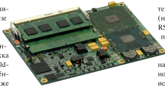
Рис. 3. Модуль CPC1301 (стандарт COM Express, процессор Intel Core 2 Duo, тактовая частота 1,5 ГГц) компании FASTWEL с установленными модулями SO DIMM

Любая компьютерная система строится на базе процессорного модуля (Host Module, или CPU Module), который может быть модулем общего или промышленного назначения. Модули общего назначения — это, как правило, изделия для бытовых нужд и изделия для приложений, не требующих наличия специализированных интерфейсов, эксплуатируемые при нормальных условиях и без особых требований по устойчивости к механическим и прочим воздействиям. Ярким примером могут выступать материнские платы для персональных компьютеров или