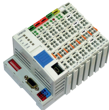
Рис. 2. ПЛК FASTWEL I/O с распределённой системой ввода-вывода

зависит от типа решаемой задачи, нежели от типа используемого оборудования. Всё это приводит к тому, что в каждой области применения складываются в качестве общепринятых свои определённые программно-аппаратные решения на базе процессоров определённой архитектуры и под управлением определённого набора встраиваемого ПО.