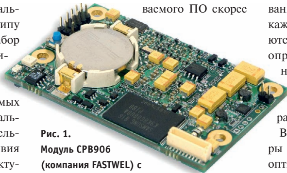
Рис. 1. Модуль CPB906 (компания FASTWEL) с размерами 65×40 мм, выполненный на базе процессора Vortex86DX архитектуры x86

тельности и функциональность системы, потребляемую ею мощность, а следовательно, и область применения. Например, процессоры архитектуры x86 могут применяться практически во всех системах, где это позволяют габаритные размеры и уровень потребляемой мощности (рис. 1). В то же время есть области применения, где прочно закрепились экономичные и малогабаритные контроллеры архитектуры ARM. Данный пример свидетельствует о том, что определяющую роль может играть не столько архитектура процессора, сколько те аппаратно-программные решения на базе этой архитектуры, которые в настоящее время представлены на рынке. Да и выбор встраиваемого ПО скорее