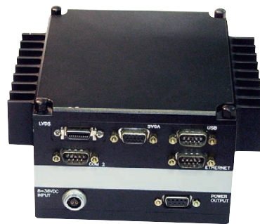
Рис. 7. Защищённые компьютеры HiDAN (слева) и IDAN (справа) компании RTD Embedded Technologies