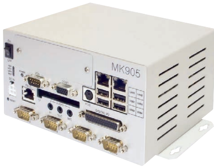
Рис. 10. Расширяемый защищённый компьютер MK905 (FASTWEL)

использование панельного компьютера необоснованно, то задействуются промышленные дисплеи требуемых размеров. При необходимости на базе защищённого компьютера и промышленного дисплея можно построить и распределённое решение: встроенный компьютер в составе оборудования размещается в промышленной обстановке или в опасной зоне, а дисплей выносится в операторскую или устанавливается на удалении, в более благоприятных для оператора условиях.