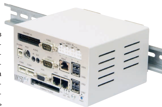
Рис. 9. Защищённый компьютер MK150 (FASTWEL) с креплением для установки на DIN-рейку

ные решения фирмы FASTWEL. Защищённый компьютер MK150 (рис. 9) представляет собой многофункциональное устройство, построенное на базе процессора AMD Geode LX800 и ориентированное на транспортное и промышленное применение, однако данный компьютер не предполагает установку дополнительных модулей расширения. Защищённые компьютеры MK905 на базе процессора AMD Geode LX800 (рис. 10) и MK800 на базе процессора Intel Pentium M допускают установку до двух дополнительных модулей расширения PC/104-Plus. Защищённые компьютеры серии МК фирмы FASTWEL – далеко не единственные решения в своём роде, но мало какие их аналоги могут похвастаться подобными характеристиками, и это при том, что компьютеры серии МК являются полностью российскими разработками, ориентированными в первую очередь на российских потребителей.