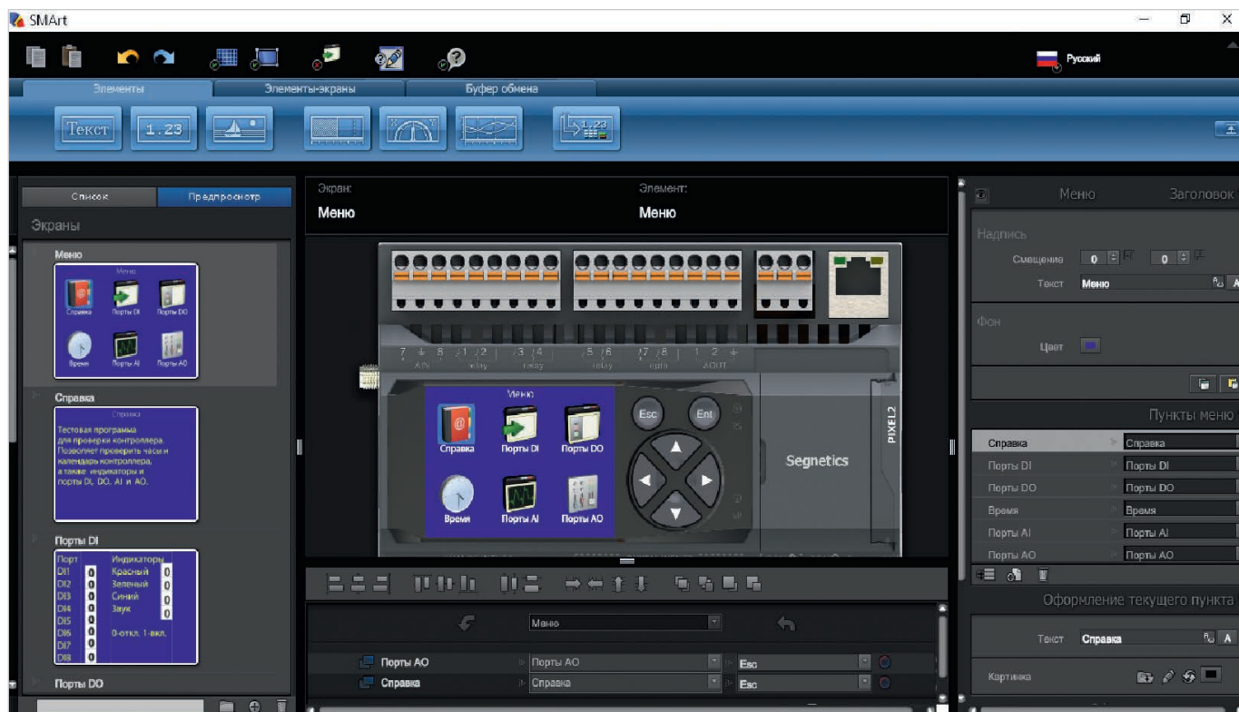
Рис. 2. Интерфейс программы