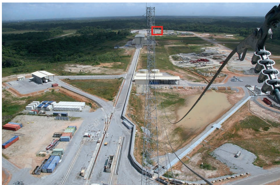
Рис. 2. Вид на СК с дивертора стартового сооружения (фотография сделана во время строительства)

программно-технический комплекс (ПТК). Эти сравнительно маленькие системы управления решали свой узкий круг задач и обменивались между собой минимальным перечнем команд и сигналов. Фактически за предпусковые операции отвечали полтора десятка программно-технических комплексов, каждый из которых работал с небольшим объёмом (около сотни) сигналов и команд. Говорить о гибкости такой системы, синхронизации данных, архивировании событий не приходится.