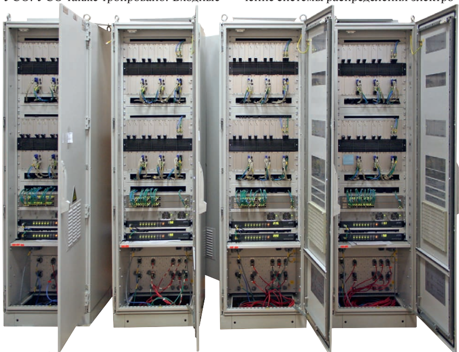
Рис. 4. Оборудование АСУ ТО (этап заводских испытаний)

В качестве контроллеров стоек и центральных обрабатывающих устройств (контроллеров управления) были использованы контроллеры фирмы FASTWEL. В центральных обрабатывающих устройствах использовались платы CPC502. Архитектура CompactPCI достаточно компактна и удобна для использования в подобных приложениях благодаря своей гибкости и широкому диапазону комплектующих: объединительных плат (компания Schroff), резервированных источников питания с глубокой диагностикой (компания Schroff), периферийных и интерфейсных плат (фирмы ADLINK и «Элкус»). То, что тяжело сделать с помощью стандартных промышленных