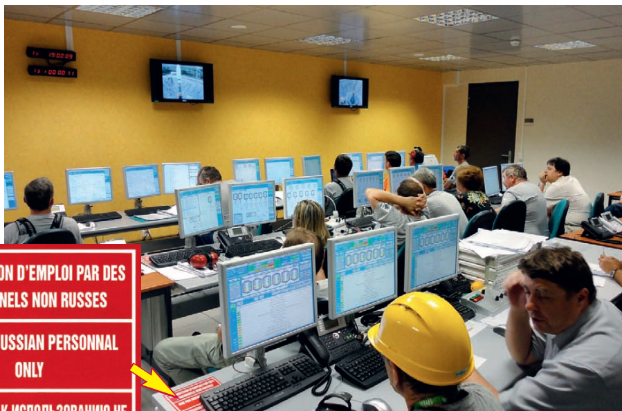
Рис. 6. Зал управления наземным ТО, находящийся в здании командного пункта (идёт имитация заправки РН в автоматическом режиме)

Во время пусконаладочных работ, в период автономных испытаний технологических систем и комплексных испытаний стартового комплекса в целом система АСУ ТО работала в режиме «24/7» значительное время (около 2 лет). Весной 2011 года состоялись комплексные испытания СК — полный цикл работы, включая заправку и пуск РН, но без компонентов топлива. Во время комплексных испытаний проверяется работа СК во всех режимах, включая проектные аварии, что позволяет проверить работу всех систем, взаимодействие персонала, отработку аварийных ситуаций и т.д. На рис. 6 можно видеть фотографию зала управления наземным ТО в один из самых ответственных моментов комплексных испытаний стартового комплекса — имитации заправки РН. Заправка компонентами топлива (в данном случае имитация полного цикла) проводится в автоматическом режиме, поэтому персоналу остаётся только ждать окончания технологического процесса и наблюдать за ходом работ на мониторах пультов управления. Оператор может вмешаться в ход автоматического процесса при необходимости (в случае нештатной ситуации, по команде руководителя работ, при некоторых других, строго регла-