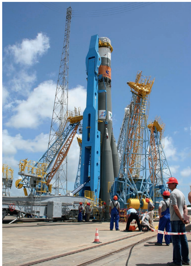
Рис. 1. Установка РН «Союз» в стартовую систему ГКЦ

Исторически на стартовом комплексе (СК) РН «Союз» каждой отдельной системой наземного технологического оборудования управлял собственный