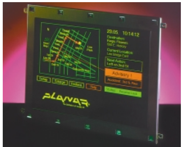
Многоцветный дисплей EL 640×480 AA1

Ответ. Фирма Planar гарантирует сохранение не менее 75% первоначальной яркости EL-дисплеев через 15 лет непрерывной работы. Совсем другая картина наблюдается при эксплуатации ЖК-дисплеев. Устройства подсветки, в частности, флуоресцентные трубки, которые применяются в обычных ЖК-дисплеях, очень быстро теряют