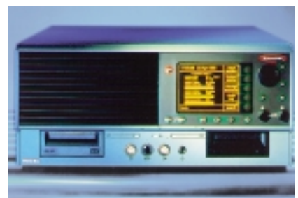
EI 320×256 в составе измерительного прибора

Ответ. Да, такое описание предоставляется.