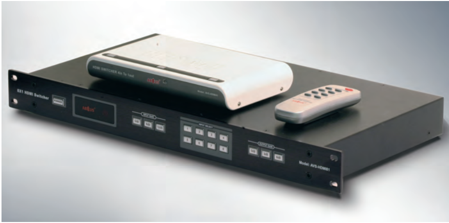
Рис. 5. Коммутаторы сигналов HDMI в корпусах для промышленного и «домашнего» применений

является достаточным для подавляющего большинства инсталляций. Эти матричные коммутаторы совместимы с HDCP, поддерживают HDMI v.1.3, осуществляют передачу данных со скоростью до 7,5 Гбит/с. «Флагманской» моделью компании Summit HD является матричный коммутатор с размерностью 4:4 и параллельными выходами на витую пару. Каждый из этих матричных коммутаторов управляется с помощью инфракрасного пульта, а коммутаторы с размерностью 4:4 — ещё и по RS-232.