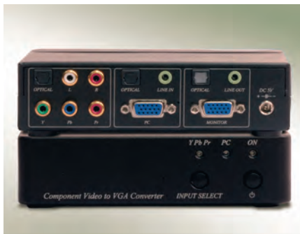
Рис. 3. Конвертер компонентного видео в сигналы VGA/XGA

Применение коммутаторов и матричных коммутаторов для построения систем DS предельно упрощает распределение контента по зонам вещания. С их помощью можно оперативно переключить нужный контент в нужную зону отображения, например в зону касс в супермаркете. Коммутаторы и матричные коммутаторы находят своё применение в системах видеонаблюдения, в системах «мультирум» и «умный» дом, в теле- и радиостудиях, в