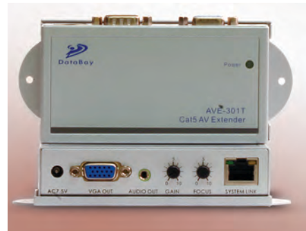
Рис. 4. Устройства для передачи сигналов VGA/XGA по витой паре

Одним из наиболее востребованных решений при построении сетей DS являются устройства для передачи сигнала по витой паре (рис. 4). Решения на их основе, используя преимущества передачи сигнала по витой паре, позволяют резко увеличить дальность передачи сигнала и эффективно решать проблему влияния электромагнитных помех на линию связи. Передача аналоговых сигналов производится по неэкранированной витой паре, как пра-