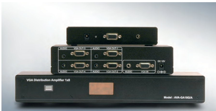
Рис. 1. Усилители-распределители сигнала VGA/XGA на 2, 4, 8 выходов

Усиление и распределение сигнала — одна из наиболее востребованных функций специализированного оборудования для построения сетей DS. Основная задача усилителя — скомпенсировать затухание сигнала, причём усиление происходит по напряжению. Сегодня существует множество производителей, которые выпускают усилители-распределители для самых разных интерфейсов, соответствующих композитному видео, S-video, компонентному видео (YUV), VGA (RGBHV). Как уже отмечалось, для построения систем DS из всех аналоговых интерфейсов, с учётом качества транслируемого сигнала, есть смысл рассматривать решения для VGA (RGBHV). Например, компания ABtUS (Сингапур) производит высококачественные усилители-распределители для сигналов VGA/XGA с размерностью от 1:2 до 1:8 (рис. 1). Подобный ряд размерностей на 85-90% перекрывает потребности каждого инсталлятора почти в любом проекте. Полоса пропускания у усилителей-распределителей ABtUS — 900 МГц, что с почти трёхкратным запасом перекрывает требования по передаче сигнала интерфейса VGA. Максимальная дальность передачи сигнала —