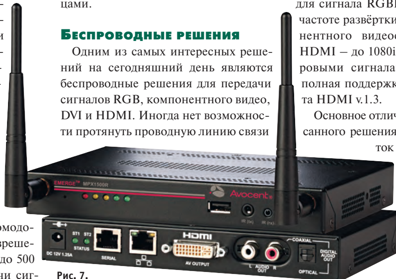
Рис. 7. Устройства для беспроводной передачи сигналов DVI/HDMI

Основное отличие MPX1550 от описанного решения – это больший поток передачи данных: до 110 Мбит/с при работе в режиме передатчик – приёмник и до 50 Мбит/с в режиме передатчик – 8 приёмников.