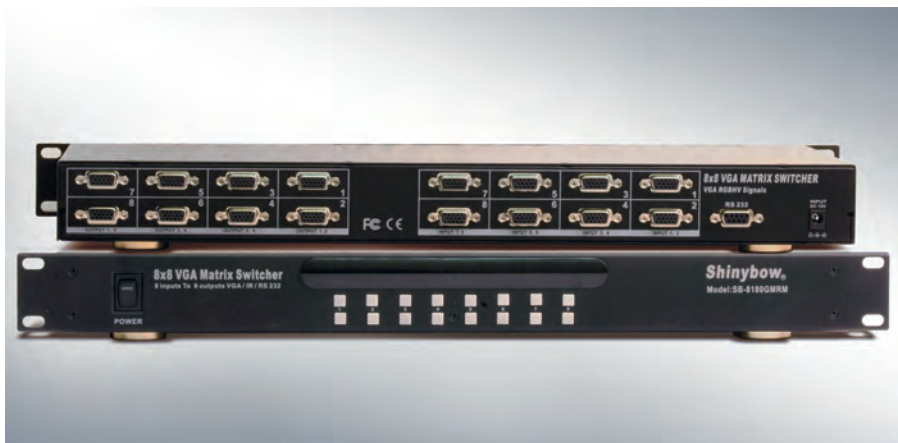
Рис. 2. Матричный коммутатор сигнала VGA/XGA с размерностью 8:8

до 70 метров с незначительным ухудшением качества. Включение усилителя в линию передачи сигнала осуществляется следующим образом: источник сигнала, короткая линия связи (кабель), усилитель сигнала, длинная линия связи, устройство отображения. Помимо построения систем DS сферой применения усилителей-распределителей могут быть мультирумные системы, оборудование конференц-залов, домашние кинотеатры, системы интерактивного телевидения, видеостены и т.д.