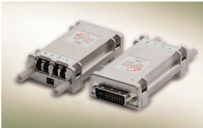
Рис. 6. Устройства для передачи сигналов DVI по оптическим линиям связи

К кабельной продукции для передачи цифровых сигналов относятся кабели DVI и HDMI. Уже упоминавшейся компанией Taylor Tech Union Ltd. вы-