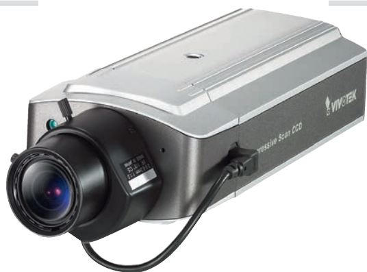
Рис. 6. Камера Vivotek IP7151