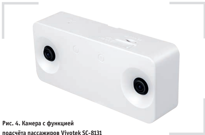
Рис. 4. Камера с функцией подсчёта пассажиров Vivotek SC-8131