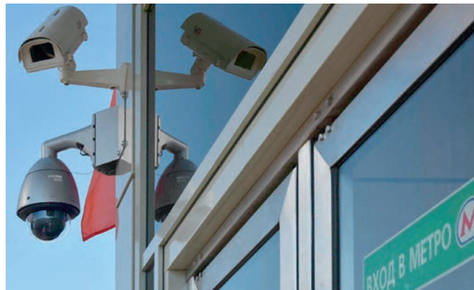
Рис. 5. Камеры, установленные возле станции Московского метрополитена

видеонаблюдения встроенной ИК-подсветкой и/или ИК-фильтрами. В свою очередь, чтобы упростить распознавание лиц перевозимых пассажиров, используются камеры с высоким разрешением и автофокусировкой. С помощью анализа видеoinформации и данных, полученных с различных GPS- или GLONASS-трекеров, можно существенно оптимизировать затраты на грузовые и пассажирские перевозки, а также исключить возможность использования служебного транспорта сотрудниками в личных целях. Как правило, оснащение коммерческого транспорта системами видеорегистрации является выгодной инвестицией, а не тратой средств для собственников бизнеса. Установка видеосистем обходится значительно дешевле вынужденного простоя и ремонта транспорта по вине некомпетентного водителя, а также выплат за ремонт других транспортных средств, пострадавших из-за его действий.