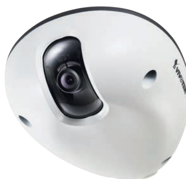
Рис. 7. Камера Vivotek MD7560

на продукцию компании Vivotek: всего на 25 станций метро Бразилии было поставлено 53 камеры IP7151 (рис. 6) и 212 камер IP7131 [2]. Камеры разработаны таким образом, чтобы обеспечивать работу днём и ночью, что позволяет с их помощью осуществлять наблюдение за объектами метрополитена в режиме 24/7. Часть камер была установлена на открытых пространствах. Благодаря всепогодным и защищённым от пыли и влаги корпусам они прекрасно справляются со своей задачей даже в сложных условиях окружающей среды. Датчики CCD позволяют отслеживать движение пассажиров, что бывает особенно важно при прибытии и отправлении поезда, так как именно тогда создаётся максимальный поток пассажиров. Камеры IP7131 устанавливались в основном в туннелях и внутренних помещениях метрополитена. Благодаря невысоким требованиям к освещённости такие камеры подходят для установки в недостаточно освещённых местах. Установка систем видеонаблюдения благоприятно сказалась на статистике преступлений на территории метрополитена.