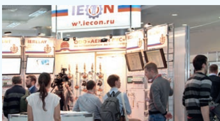
На экспозиции выставок «Передовые Технологии Автоматизации. ПТА-Урал 2016» и «Электроника-Урал 2016»

— Подписанное соглашение станет началом большой совместной работы. Уверен, что внедряемые цифровые решения и технологии «Сименс» помогут нашему партнёру достичь ряда преимуществ: сократить сроки запуска новых автомобилей, снизить трудоёмкость при серийном производстве и уменьшить себестоимость готовой продукции, — отметил Роланд Буш. ●