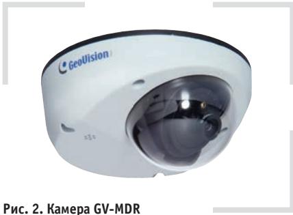
Рис. 2. Камера GV-MDR

ного времени. Чаще всего установка системы видеонаблюдения на транспорте с целью отслеживания рабочего процесса водителя носит превентивный характер. Зная, что в салоне установлены камеры, водитель с большей вероятностью будет качественно выполнять свои рабочие обязанности и не станет нарушать правила дорожного движения. В целом все описанные утверждения актуальны и для других видов общественного наземного транспорта — троллейбусов и трамваев, с небольшими отклонениями в плане функциональности.