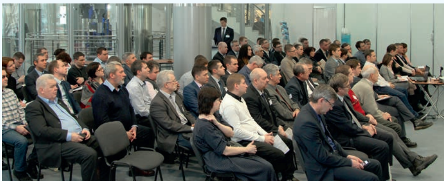
Заседание Совета по ИКТ Союза предприятий оборонных отраслей промышленности Свердловской области

С 28 по 30 ноября 2017 года в Центре международной торговли Екатеринбург состоятся главные для Уральского региона события в области автоматизации и электроники — XIII Международная специализированная выставка «Передовые Технологии Автоматизации. ПТА-Урал 2017» и III Международная специализированная выставка «Электроника-Урал 2017». Место проведения: г. Екатеринбург, ул. Куйбышева, 44Д. Организатор: ООО «ЭКСПОТРОНИКА».