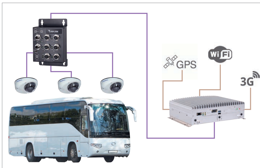
Рис. 1. Пример построения системы видеонаблюдения в автобусе на базе продукции компании GeoVision

вершённые ими правонарушения, или сделать это просто из хулиганских побуждений. Количество камер, устанавливаемых в автобусе, зависит от типа автобуса. Как правило, хватает 6–8 камер, чтобы полностью покрыть большой городской автобус. При этом на салон приходится 4–6 камер, изображение с которых выводится через бортовой компьютер или регистратор в кабину водителя. Благодаря современным бортовым компьютерам возможно и отслеживание местоположения автобуса с использованием технологий GPS или GLONASS. Также при условии наличия в бортовом компьютере 3G- или 4G- модема возможна передача данных в диспетчерский центр в режиме реаль-