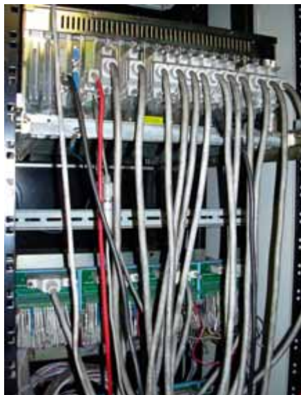
Рис. 4. Внешний вид панелей кроссового шкафа

сбор и распределение всех управляющих сигналов. Внешний вид панелей кроссового шкафа показан на рис. 4. Степень защиты оборудования от воздействия внешних факторов – не менее IP54. Центральный контроллер реализован на базе промышленного шасси IPC-623 и платы центрального процессора PCA-6003, выполненной в формате PICMG. Кроме платы центрального процессора, на объединительной плате промышленного шасси установлены следующие модули УСО: