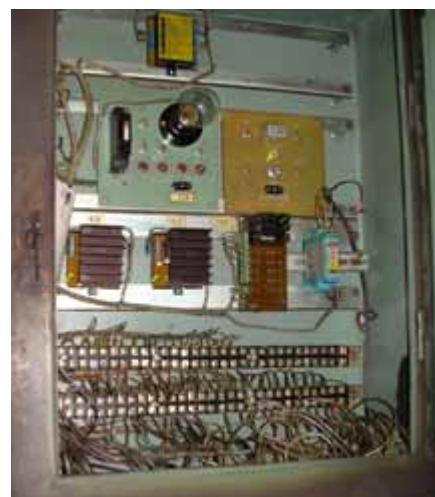
Рис. 2. Внешний вид блока местного управления (БМУ)

Нижний уровень системы — уровень полевой автоматики и средств измерений. Он предназначен для сбора и преобразования информации, поступающей с датчиков, а также для передачи управляющих воздействий на исполнительные механизмы (приводы шнековых питателей и шиберов пылевых заслонок). Оборудование нижнего уровня скомпоновано в виде блоков местного управления (БМУ) и шкафов управления приводами шнековых питателей.