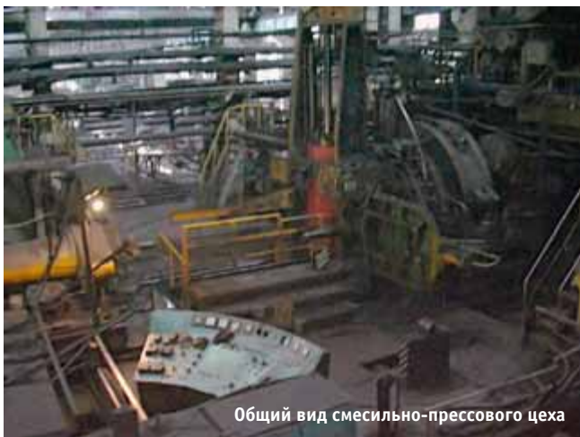
Общий вид смесильно-прессового цеха