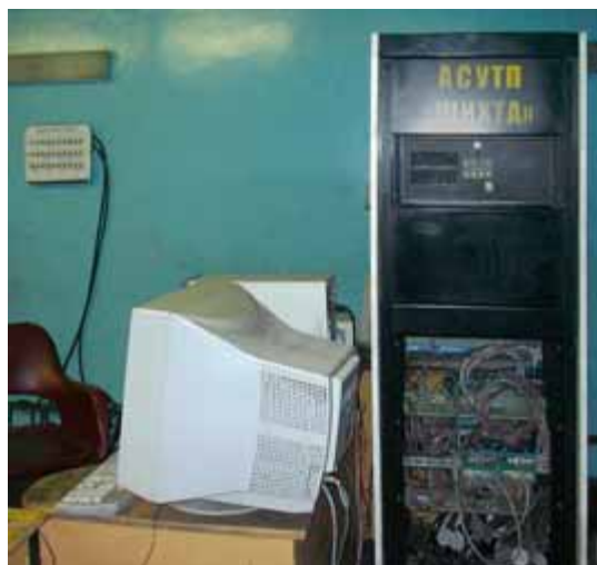
Рис. 3. Внешний вид шкафа управления с центральным контроллером, реализованным на базе промышленного шасси IPC-623

Оборудование нижнего уровня также представлено бесконтактными датчиками положения задвижек шиберов на пылевых бункерах и датчиками положения дозирочной тележки. Применение последних связано с необходимостью контроля работы оператора-дозировщика при составлении рецепта на нескольких дозирочных бункерах. Для этих же целей предназначены трёхцветные светофоры, установленные в непосредственной близости от дозаторов: зелёный цвет означает готовность дозатора к выгрузке, жёлтый сигнализирует