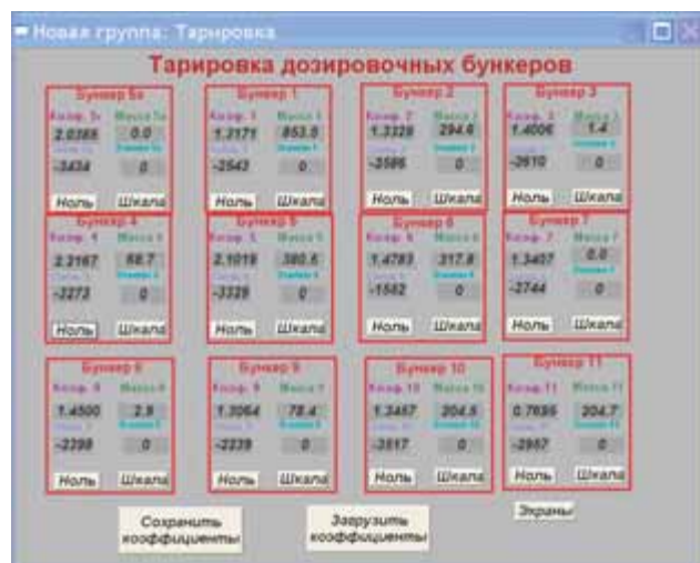
Рис. 5. Пример рабочего экрана системы управления

Авторы – сотрудники НПК «Югцветметавтоматика», телефон: (8672) 74-6334 и ОАО «Новочеркасский электродный завод», телефоны: (86352) 33-474, 94-184