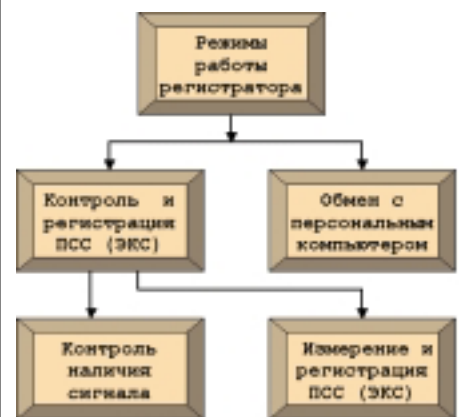
Рис. 4. Режимы работы регистратора

активностью мышц, и точного выделения моментов появления R-зубцов кардиосигнала. Абсолютное значение продифференцированного сигнала сравнивается с порогом, значение которого автоматически подстраивается под максимумы сигнала, так чтобы обеспечить уверенную регистрацию R-зубца, но в то же время и защиту от ложных срабатываний в результате действия помех. В случае превышения порога производится вычисление ПСС как интервала между текущим и предыдущим появлением R-зубца и запись вычисленного значения в запоминающее устройство. По окончании вычислений ОЭВМ переводится в холостой ход, что значительно уменьшает ее среднее энергопо-