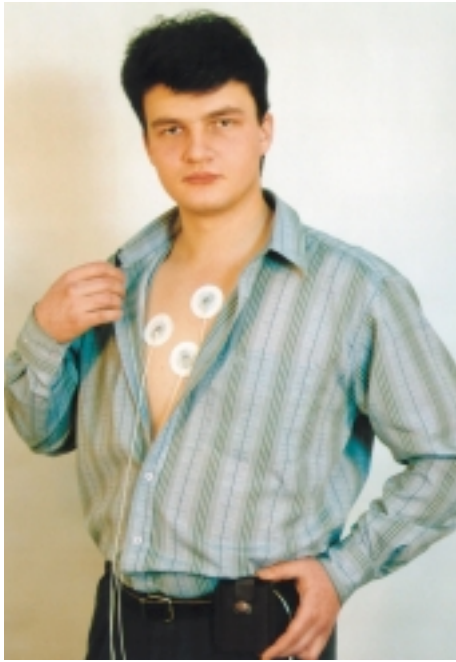
Рис. 2. Автономный регистратор, установленный на теле пациента

рез один и тот же разъем, как показано на рисунке. Поэтому только после отключения электродов регистратор может быть соединен для передачи накопленных данных через линию связи с ПК. Это исключает появление на электродах прибора потенциалов, опасных для здоровья обследуемого пациента.