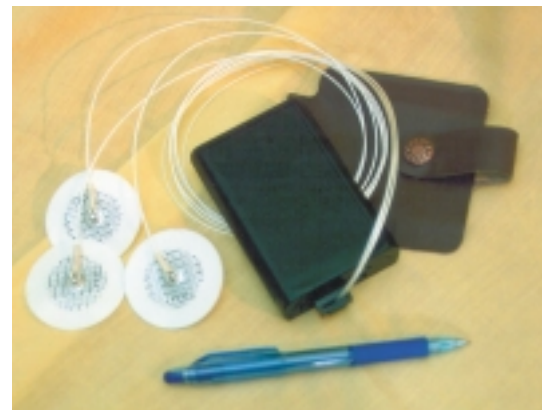
Рис. 1. Внешний вид автономного регистратора сердечных сокращений

Проблема обеспечения электрической безопасности при использовании регистратора решена следующим образом. Конструктивно прибор выполнен так, что подключение к нему электродов и линии связи с ПК выполняется че-