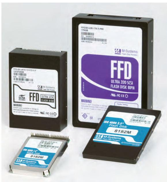
Твердотельные диски компании SanDisk (M-Systems)

С позиций TCO накопители HDD, обладая низкой входной стоимостью, существенно проигрывают SSD по всем остальным параметрам. Ожидаемый срок службы для HDD составляет