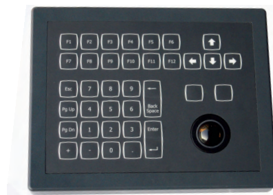
Рис. 13. Малогабаритная клавиатура KSTC36