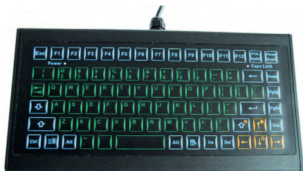
Рис. 3. Клавиатура TKF-085a-BACKL