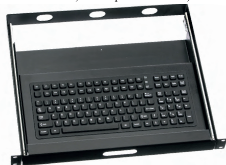
Рис. 5. Клавиатура для 19-дюймовых шкафов RDC-1000

2. Серия NightVision использует электролюминесцентную подсветку, интенсивность которой автоматически регулируется в зависимости от степени освещённости. У модели KSTL105 (рис. 9) освещается не только символ, но и край клавиши, а так-