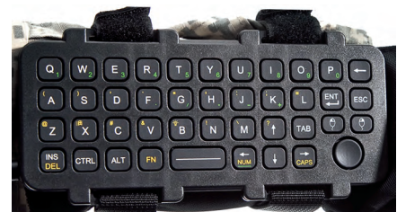
Рис. 11. Мобильная клавиатура АК-39

Приведём несколько примеров использования промышленных клавиатур на морских и воздушных судах. В состав лётно-испытательной аппаратуры, установленной на современном российском пассажирском самолёте ОКБ «Сухой» SSJ-100, входит клавиатура компании InduKey TKS-105a-