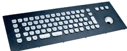
Рис. 7. Карбоновая клавиатура серии InduDur TKV-068