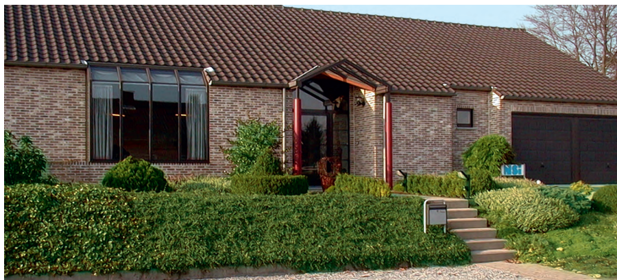
Офис компании NSI