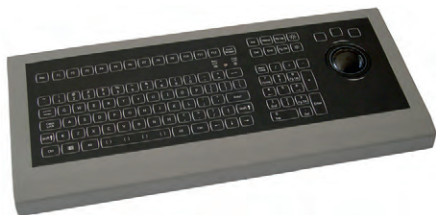
Рис. 8. Модель KSML106 с LED-подсветкой