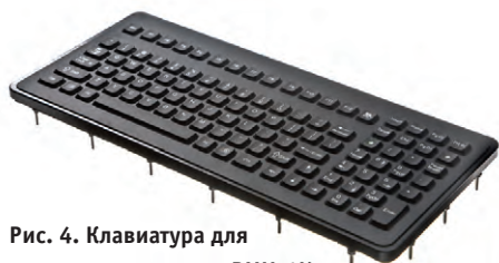
Рис. 4. Клавиатура для панельного монтажа PMU-1K

личных видов монтажа, и корпуса изготавливаются из разных материалов. Клавиатуры DT-5K (рис. 6) и PM-5K имеют корпус из нержавеющей стали, что позволяет применять их в жёстких условиях, они оснащены указательным устройством HulaPoint.