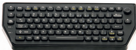
Рис. 10. Малогабаритная клавиатура SK-79

же контур трекбола. Регулировка яркости имеет 8 степеней. Здесь применяется внешний адаптер питания. Имеется 105 короткоходовых клавиш и встроенный трекбол диаметром 50 мм, а также встроенный контроллер PS/2 или USB.