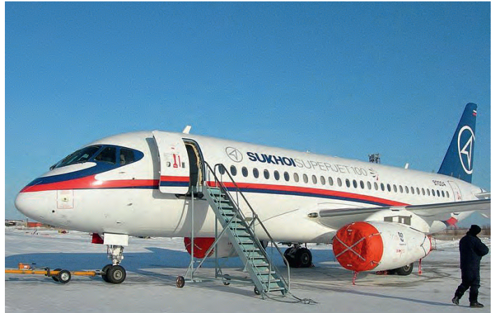
Рис. 14. Применение клавиатуры Indukey на самолёте SJJ-100