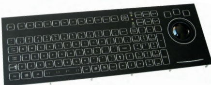
Рис. 9. Клавиатура с электролюминесцентной подсветкой KSTL105