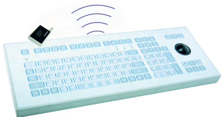
Рис. 2. Модель TKS-105-TB-KGEN-RF