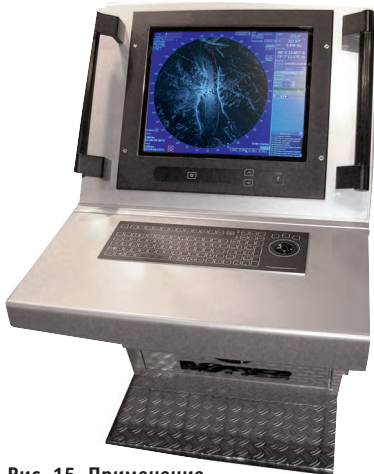
Рис. 15. Применение клавиатуры NSI в составе морского навигационного оборудования

TB50-MODUL (рис. 14). Компания «НавМарин» разрабатывает навигационные системы для морских маломерных судов. В состав комплекса оборудования входит доработанная клавиатура производства NSI серии Night Vision KSTL106 (рис. 15).