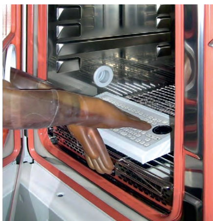
Испытание клавиатуры в климатической камере

Все три компании, которые представлены в этом обзоре, имеют на своём производстве лаборатории по тестированию оборудования как по температурным параметрам (климатические камеры), так и по механическим воздействиям (системы ресурсных испытаний). Гарантийный срок составляет 1 год со дня продажи.