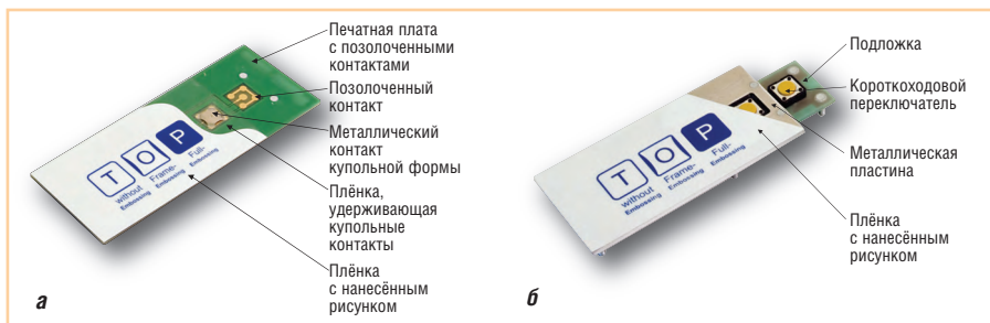
Рис. 1. Конструкция клавиатуры: а) мембранной; б) короткоходовой

в форме купола. Теперь оператор точно знает, нажата клавиша или нет, так как при нажатии на клавишу вставка, имеющая упругую конструкцию, пружинит и даёт выраженный эффект обратной связи. Типы конструкции данных клавиш представлены на рис. 1. Это профилированная по периметру клавиша, которая может быть как углублённой, так и приподнятой, или клавиша в виде купола. Также в мембранных клавиатурах применяется технология gold-on-gold (позолоченные купола кнопок и позолоченные контактные площадки). Мембранные клавиатуры обладают запасом надёжности и в среднем выдерживают 6 миллионов нажатий.