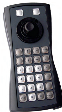
Рис. 12. Пульт-клавиатура KBTS26