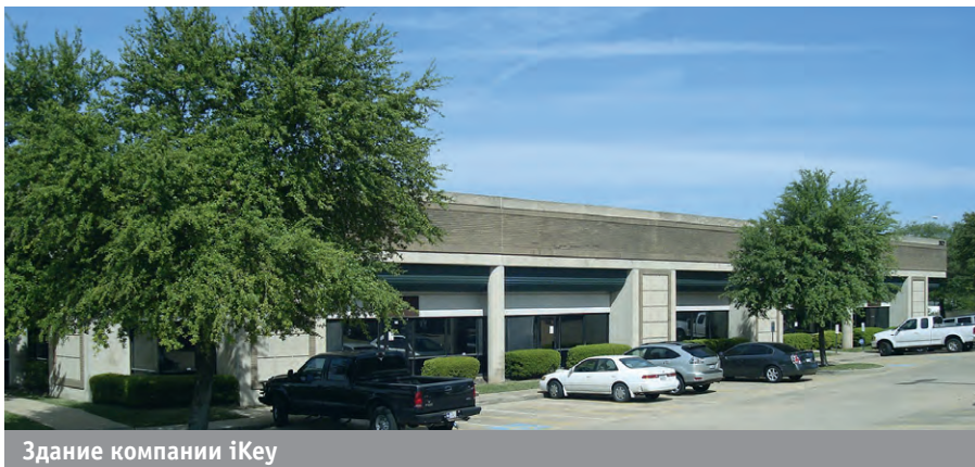
Здание компании iKey

В 1986 году Норберт Шеперс в Бельгии основал семейный бизнес, основным направлением которого является