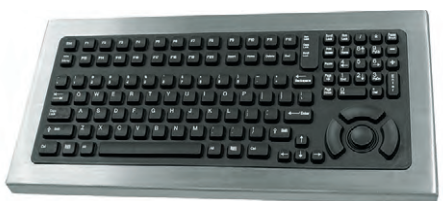
Рис. 6. Настольная клавиатура DT-5K