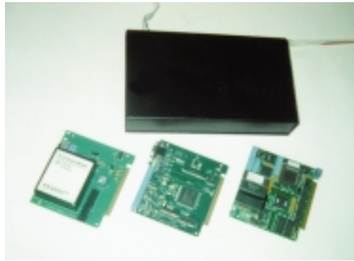
Рис. 2. «Начинка» системного блока и его внешний вид

Для возможных применений в экстренных службах города разработано несколько вариантов бортовых средств, отличающихся между собой массогабаритными параметрами, конструктив-