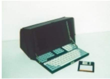
Рис. 5. Настольный вариант аппаратуры

Необходимость размещения бортового компьютера практически в любом легковом или грузовом автомобиле привела к разработке данного варианта с отдельными системным блоком (аналогично варианту «Окта-1») и блоком видеомонитора с клавиатурой (каркас