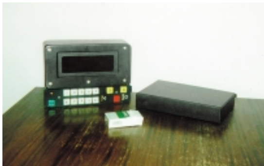
Рис. 3. Дешевый вариант с сокращенными возможностями по вводу/выводу информации

В данном варианте (рис. 3) использовано табло Т0623, примененное в предыдущих разработках подвижных объектов и зарекомендовавшее себя превосходными пользовательскими характеристиками: высокая яркость, позволяющая читать информацию с экрана при солнечном освещении, достаточная емкость экрана для небольших текстовых сообщений (3×16 знаков), хорошая читаемость информации (величина знака 6×9 мм), удобная клавиатура, позволяющая осуществлять прием, обработку информации и набор формализованных