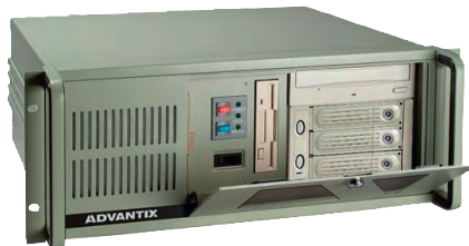
Рис. 4. Высокопроизводительная станция оператора АСУ повышенной надёжности