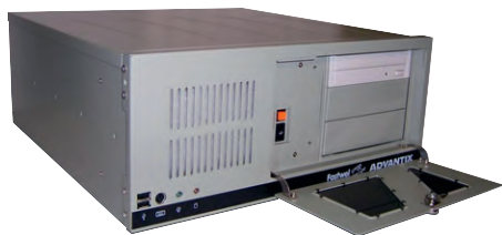
Рис. 3. Станция технологического управления AdvantiX