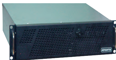
Рис. 5. 2U-станция оператора АСУ IPC-2U-SYS9-A8