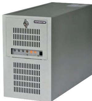
Рис. 6. Высокопроизводительная станция оператора АСУ настольного исполнения IPC-ATX-7220-A8

нечном итоге на выбор, который делает заказчик.