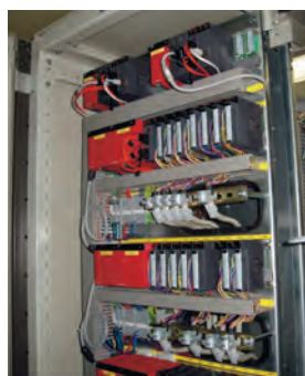
Рис. 2. Пример монтажа резервированной системы на основе сети MELSECNET/H в едином шкафу.

программисты при работе с резервированными контроллерами, является организация обмена данными с сервером верхнего уровня (например, со SCADA-системой) как от коммуникационного модуля Ethernet основного контроллера, так и от аналогичного модуля резервного контроллера. Поскольку модули, как правило, включены в одну и ту же сеть Ethernet, они обязаны иметь различные IP-адреса, что осложняет программирование SCADA-системы. OPC-сервер, поставляемый Mitsubishi Electric, располагает специальной функцией для работы с резервированными системами, что позволяет программировать SCADA как если бы она работала с обычным одиночным контроллером.