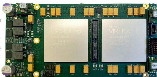
Рис. 2. ХМС-модуль с кристаллами LX550

Основным вычислительным элементом БВР выступает ХМС-модуль с двумя кристаллами ПЛИС (рис. 2). Отличительной особенностью является использование модельного ряда ПЛИС серии Virtex-6. На модуле установлены две пользовательские ПЛИС (X1 и X2). Каждая из пользовательских ПЛИС симметрично подключена к слоту расширения для установки в него различных мезонинных модулей, на которых