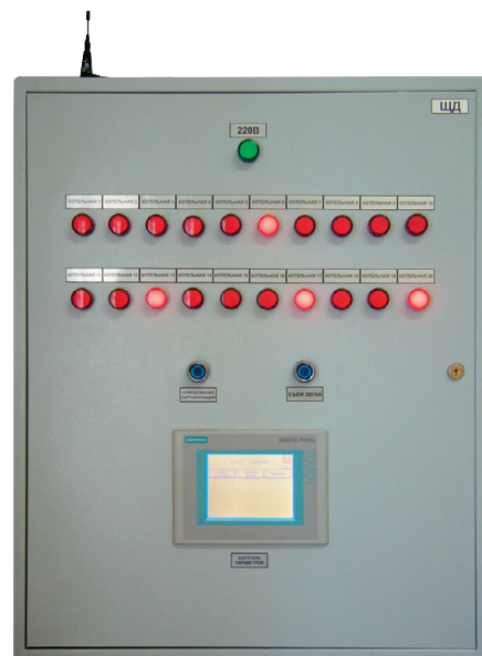
Рис. 3. Щит диспетчеризации, установленный в центральном диспетчерском пункте

При возникновении аварийной ситуации на щите включается соответствующая световая индикация. Одновременно с этим ПЛК формирует данные для передачи на ЩД. Данные состоят из идентификатора котельной, кода аварийной ситуации и контрольной суммы для проверки целостности и достоверности сообщения. Сформированные данные передаются на ЩД