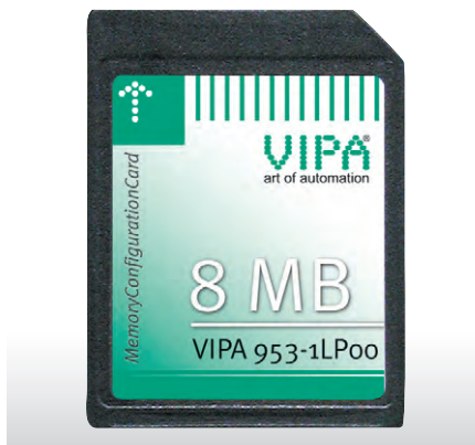
Рис. 3. Карта ММС для конфигурирования памяти контроллера

контроллера объём оперативной, или рабочей, памяти, непосредственно определяющий размер программы управления, является величиной постоянной. При этом, как правило, в рамках одной серии устройств объём такой памяти растёт от младших моделей к старшим, сопровождаясь при этом увеличением и другого функционала устройства. При выборе оборудования для решения задачи (а делается это, как правило, на ранней стадии проектирования системы) разработчик системы управления вынужден переизобретать и выбирать процессорный модуль с таким объёмом оперативной памяти, которого заведомо хватит для размещения будущей программы. Результатом подобного подхода является использование оборудования с заведомо избыточными функциональными возможностями, что, безусловно, самым отрицательным образом сказывается на общей стоимости контроллера. Ещё хуже ситуация, когда при модернизации системы управления уже в процессе её эксплуатации вдруг выясняется, что новый вариант управляющей программы с добавленными в неё новыми функциями не помещается в память контроллера.