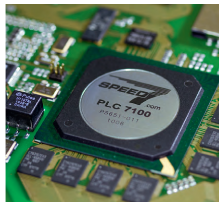
Рис. 1. Специализированный процессор PLC 7100

Как бы то ни было, медленная последовательная шина по определению является своеобразным бутылочным горлышком при обмене данными между